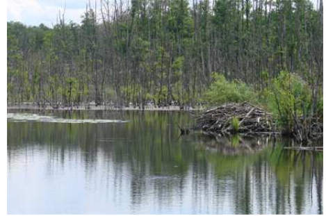
In die verschiedenartigen Waldflächen fügen sich Waldwiesen, Moore, Fließ- und Standgewässer mosaikartig ein. Der Biber hat sein Zuhause am Faulen See.

Die Stiftungsflächen sind vorrangig mit Buchen- und Eichen-Kiefern-Wald bestockt. Die NABU-Stiftung überlässt diese Wälder vollständig sich selbst, sodass durch die natürliche Dynamik langfristig neue „Urwälder“ entstehen können. Es werden sich auf lange Sicht auch auf den bislang naturferneren Standorten natürliche, totholzreiche Buchenmischwälder entwickeln.