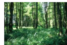
Landschaftsvielfalt im Naturschutzgebiet Salveytal