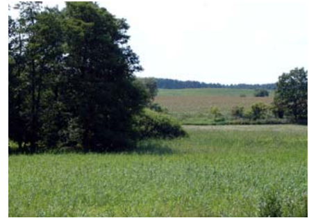
Röhricht bei Tantow

Mit den Flächenübernahmen im Jahr 2010 und Anfang 2011 erhielt die NABU-Stiftung aus dem Flächenpool des Nationalen Naturerbes den rund 12 Hektar großen nördlichen Ausläufer des Naturschutzgebietes in Angrenzung an die Ortslage von Tantow. Dieser Bereich ist durch offene feuchte Wiesen und Röhrichte mit vereinzelt Baumgruppen und Büschen gekennzeichnet. Die Wiesen hat die NABU-Stiftung unter naturschutzfachlichen Auflagen verpachtet, um sie als Lebensraum für die Tiere und Pflanzen der offenen Kulturlandschaft zu erhalten.