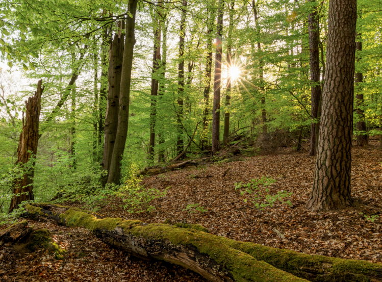
Im Biesenthaler Becken bei Berlin darf sich der Wald vom Menschen ungestört entwickeln.