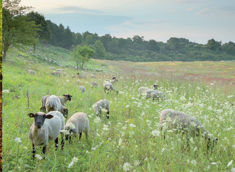
Unsere Wiesen im Naturparadies Piepergrund in der Uckermark lassen wir naturschonend beweiden.