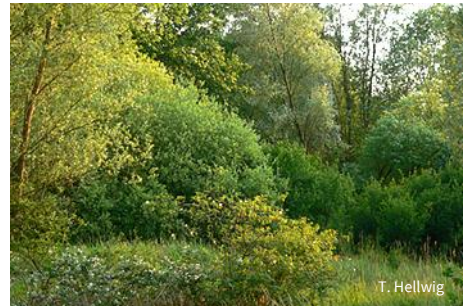
Wald im Bürgerholz

Die NABU-Stiftung bewahrt derzeit 19,44 Hektar des Bürgerholzes in ihrem Eigentum. Die Waldflächen und ungenutzten Offenlandbereiche sind der natürlichen Entwicklung überlassen, um künftig als Naturwald mit hohem Totholzanteil und großem Altbaumbestand den vom Aussterben bedrohten Großvogelarten einen sicheren Lebensraum zu bieten.