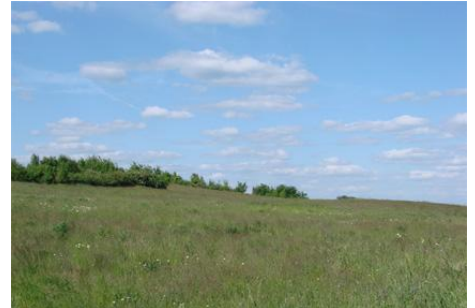
Die artenreiche, offene Landschaft bietet Lebensraum für wiesenbrütende Vogelarten.

Eine Erweiterung der Flächen der NABU-Stiftung ist bereits absehbar. Aus dem Pool des sogenannten „Nationalen Naturerbes“, der von der Bundesregierung als für den Naturschutz wertvoll anerkannten Flächen, wird die NABU-Stiftung weitere 4,4 Hektar erhalten. Die kaufpreislose Übertragung wird voraussichtlich ab 2010 erfolgen. Diese Flächen werden aktuell größtenteils als Grünland genutzt.