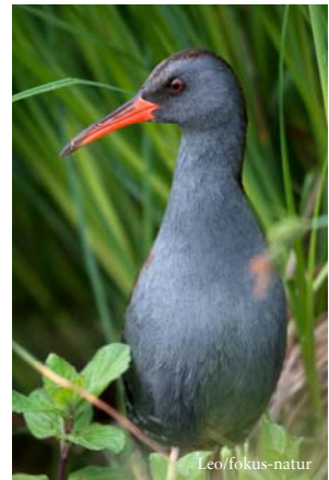
Die scheue Wasserralle fühlt sich in den Uferbereichen von Seen und flachen Gewässern wohl.

Die vielfältige Tier- und Pflanzenwelt ist für Besucher gut erlebbar. Ende 2012 wurde hierfür ein Beobachtungsturm aufgebaut und 2013 ein „Brehm“-Rundwanderweg mit Informationstafeln eröffnet.