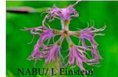
NABU/ J. Einstein