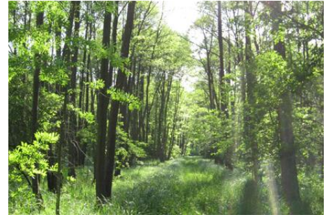
Das lückige Kronendach im Erlen-Eschenwald weist auf die Entwässerung der ehemals feuchten Standorte hin.

Die NABU-Stiftung wird ihre Waldflächen ganz der natürlichen Entwicklung überlassen. Durch den Verzicht auf jegliche Pflege und Nutzung können sich wieder Naturwälder entwickeln, die mit ihrem Totholzreichtum und ihren Altbäumen vielfältige Lebensräume für Tiere und Pflanzen bieten.