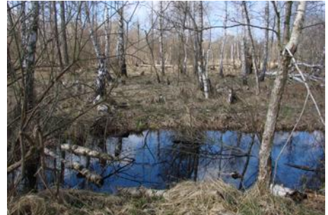
Auenwälder mit zahlreichen Kleingewässern, viel Unterwuchs und Totholz kennzeichnen die Flächen der NABU-Stiftung.

Alle Flächen sind nicht bewirtschaftet und sich selbst überlassen. Eine natürliche Entwicklung ist das naturschutzfachliche Ziel. Vor Ort betreut die Flächen der NABU-Kreisverband aus Frankfurt/Oder durch regelmäßige Kontrollgänge.