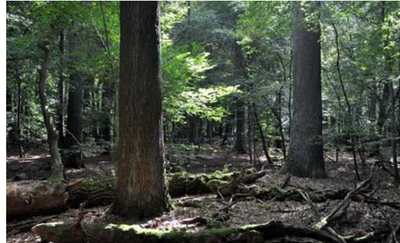
Die naturnahen Wälder im „Tiergarten“ können sich schon seit langem weitgehend frei von forstlichen Eingriffen entwickeln.

Zur Abrundung des Flächenbesitzes und Unterstützung dieses Engagements wird die NABU-Stiftung im Roten Luch und Tiergarten auch in Zukunft Flächen erwerben.