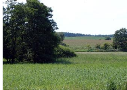
Röhricht bei Tantow

Den größten Teil ihrer Flächen erhielt die NABU-Stiftung aus dem Bestand der bundeseigenen Treuhandnachfolgegesellschaft BVVG. Die ersten rund 27 Hektar innerhalb einer Waldfläche zwischen Tantow und Geesow wurden der Stiftung 2004 übereignet, gefolgt von weiteren Teilflächen 2006. Im Salveytal hat die NABU-Stiftung damit sowohl forstlich stark überprägte wie auch naturnahe Waldbestände übernommen. Während die feuchten Erlen-Eschen- und Erlenbruch-Wälder als bereits naturnahe Lebensräume gänzlich einer ungestörten Entwicklung überlassen werden, sind für die standortsfremden Kiefern- und Fichtenforste zukünftig noch forstliche Maßnahmen geplant.