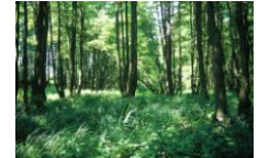
Landschaftsvielfalt im Naturschutzgebiet „Salveytal“