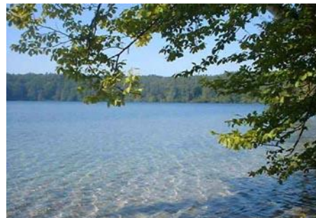
Brandenburgs sauberster See: Der Stechlin. Eine Besonderheit ist die ‚Kleine Maräne‘, die im Volksmund Quietschbauch genannt wird und nur hier vorkommt. Weil sie auf sauberes Wasser angewiesen ist, dient sie der Wissenschaft als Indikator für den Zustand des Ökosystems.

NABU-Stiftung Nationales Naturerbe Charitéstr. 3, 10117 Berlin Tel. 030 – 284 984 1800 Fax 030 – 284 984 2800 Naturerbe@NABU.de www.Naturerbe.de